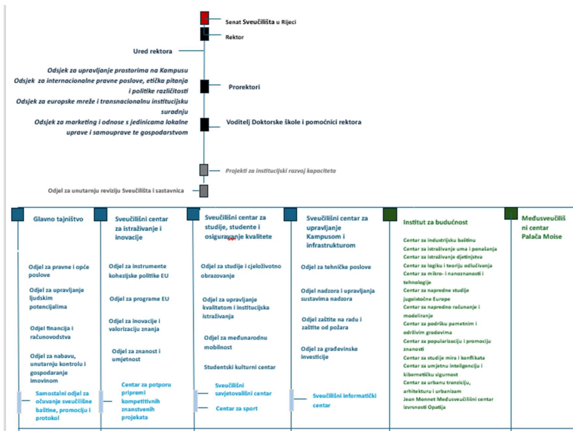
Slika 2. Organigram Rektorata

Sve sastavnice i povezane ustanove čine funkcionalnu cjelinu u okviru Sveučilišta u Rijeci, pri čemu je struktura temeljena na načelu autonomije sastavnica uz koordinaciju na sveučilišnoj razini, osobito u pitanjima strategije, razvoja, kvalitete i zajedničkih infrastrukturnih resursa, a njihovo je djelovanje usmjereno na ostvarivanje zajedničke misije obrazovanja, znanosti i društvenog razvoja.